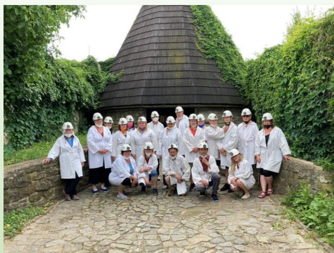
Horníci z Hartmanic

Hlavně jsme ale vybaveni perkytlí (hornická halena s kápí) a helmou se svítilnou zdolali původní středověký důl, jehož hlubinné chodby křížují kopec pod Jezuitskou kolejí. Největší výkony jsme předvedli na 10 metrů dlouhém úseku s maximální výškou 120 cm a šířkou 40 cm! Překonání strachu, klaustrofobických stavů i sebe sama si zasloužilo odměnu v podobě podvečerního rozchodu po městě.