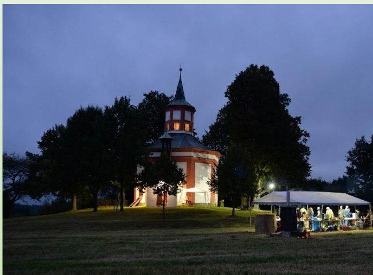
Stánek s občerstvením s barem z balíků

Na závěr zahrála a zazpívala Políčská schola , jejich úžasné vystoupení se ke kapličce velmi hodilo a udělalo dokonalou tečku za víkendovým hraním.