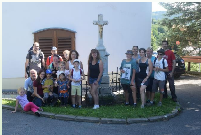
Po splnění jednoho z úkolů u kaple v Hlásnici

O prázdninách jsme se vydali za poznáním svojanovských strašidel . Seznámili jsme se s holičem Kubičkem, babou Kalafunou, panem Hamrlíkem, ohnivou sviní, obrem Pulusánem a Mezulíny.