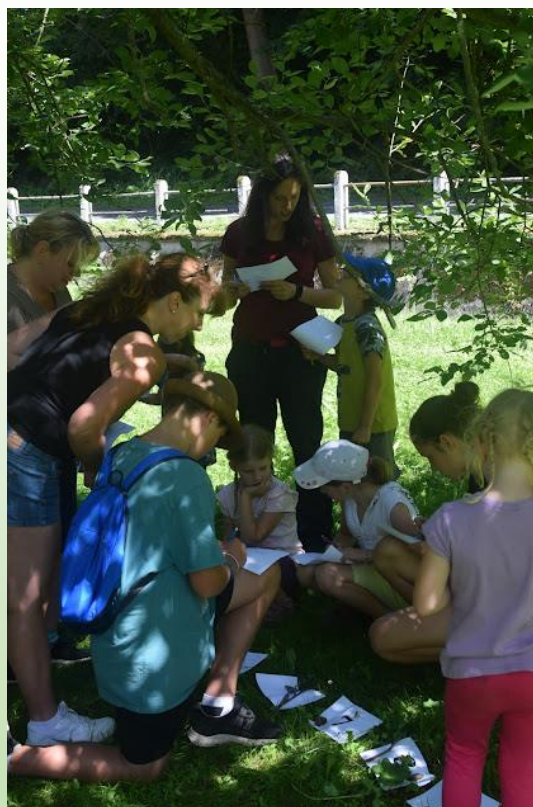
Poznávka rostlin nasbíraných po cestě

strašidla z knihy Tajemný hrad Svojanov od Bohuslava Březovského? Přečtěte si ji.