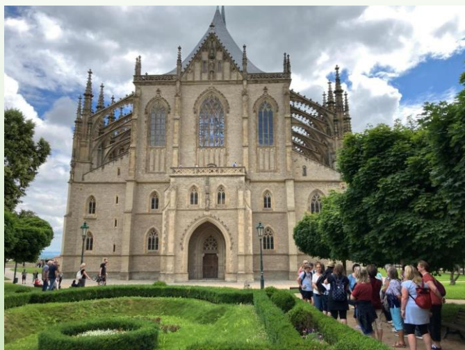
Chrám sv. Barbory

5. července jsme vyrazili na společný poznávací zájezd do Kutné Hory. Návštěvu „Pokladnice českých králů“ jsme započali komentovanou prohlídkou města od kláštera Voršilek, přes Kamenný dům, Kamennou kašnu, Dačického dům, Vlašský dvůr, kostel sv. Jakuba s jeho nádhernou vyhlídkou, přes středověkou Ruthardskou uličku, Hrádek a Jezuitskou kolej až k dominantní katedrále sv. Barbory.