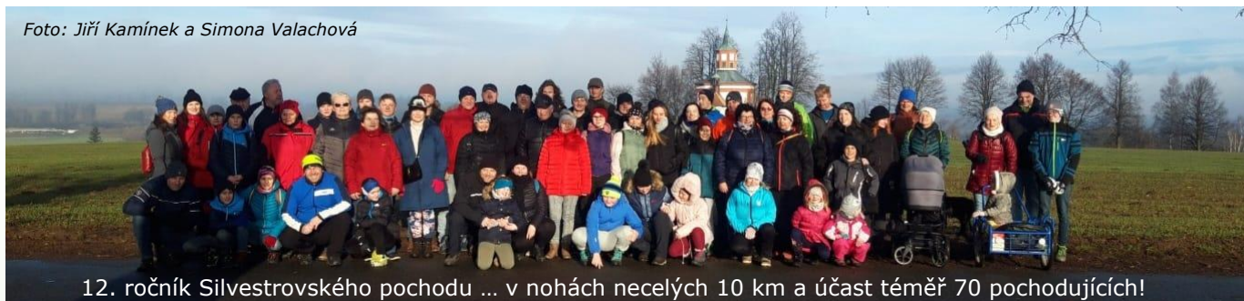
12. ročník Silvestrovského pochodu ... v nohách necelých 10 km a účast téměř 70 pochodujících!