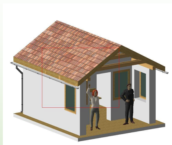
Vizualizace nové zastávky: Libor Pospíšil

této akci zbourat, pod povrch nové zastávky umístit atypickou plastovou vodoměrnou šachtu, kde bude umístěna výše zmíněná technologie. Větev vodovodního řadu, v níž je třeba zvýšit tlak, vede ve vozovce před zastávkou, nebude tedy problém udělat odbočku k tlakové stanici.